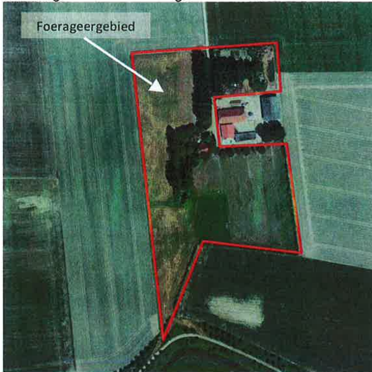
Figuur 7: luchtfoto territorium 3

Territorium 3 ligt ingeklemd tussen de Langeweg en de Hogedijk. Het habitat bevindt zich rondom de boerderij. Er is broedmogelijkheid in de op het erf staande schuren. Het foerageergebied bestaat uit beweid en gemaaid grasland rondom de bedrijfsgebouwen. Alle ingrediënten voor een goed steenuilbiotoop zijn hier aanwezig. De locatie blijft na de inrichting van Waterdunen gehandhaafd.