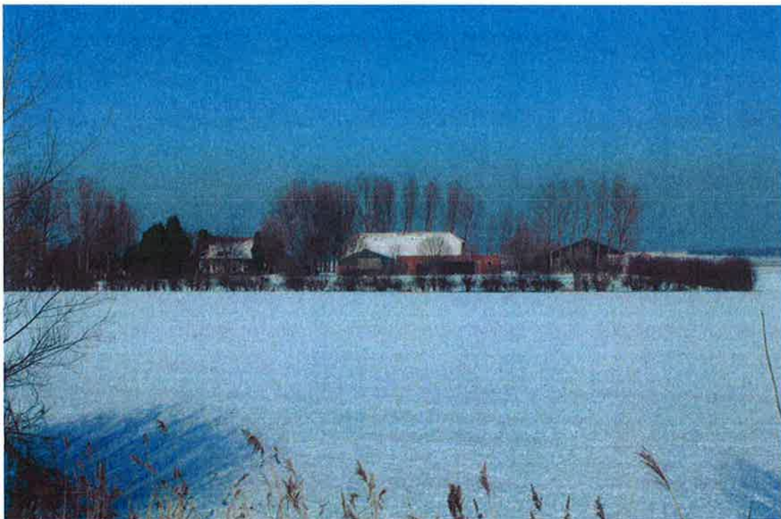
Figuur 8: zuidzijde territorium 3 vanaf de Hogedijk (februari 2012)