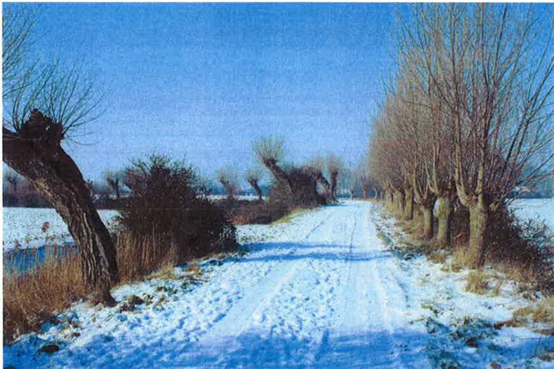
Figuur 10: zicht op de Nolletjesdijk richting Hogedijk Groede (februari 2012)