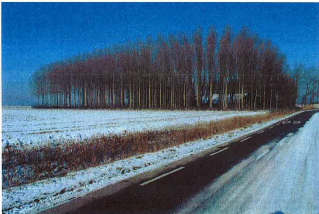
Figuur 6: zuidzijde territorium 2 met zicht op woonhuis en schuur (februari 2012)